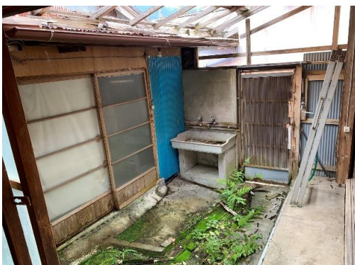
外流し・離れ外観