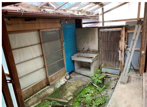
外流し・離れ外観