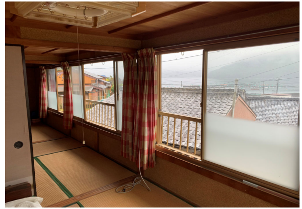
二階から見た景色