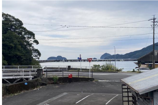
北側建物2階からの眺め