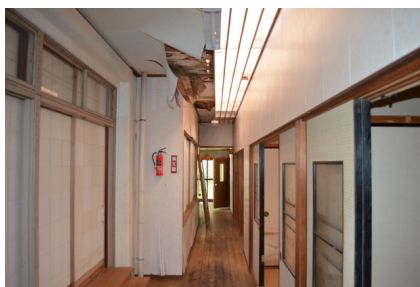
廊下部分雨漏り箇所