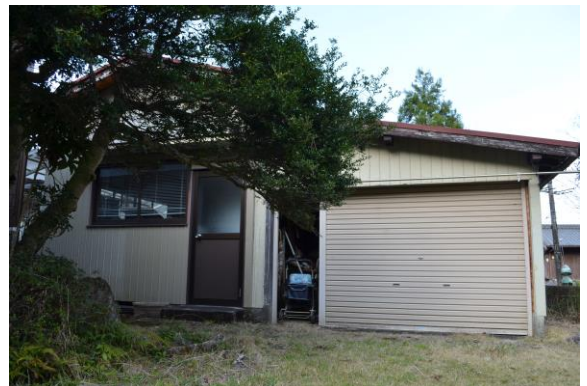
離れの事務所とガレージ