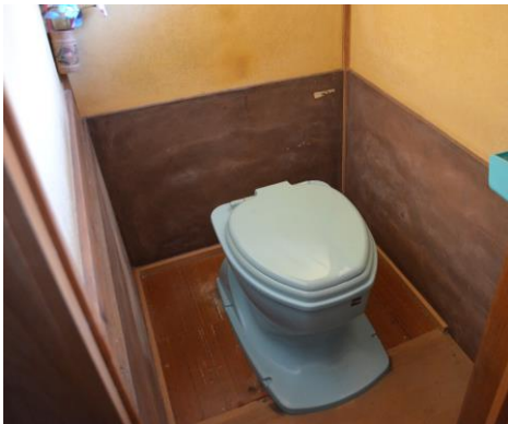
平屋汲取りトイレ