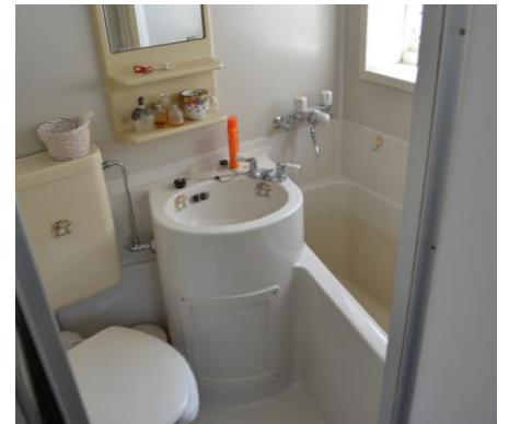
2階建てユニットバス