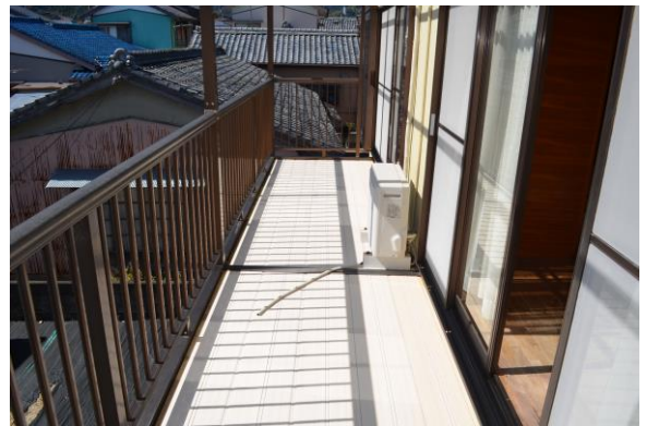
日当りの良いベランダ