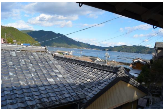
窓から賀田湾を望む