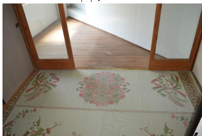
和室3畳・板の間部分