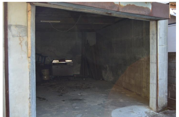
屋根付き駐車場有