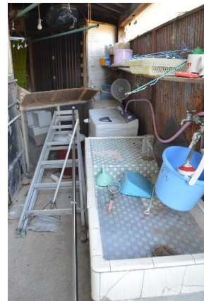
裏口に洗い場と洗濯機置き場有