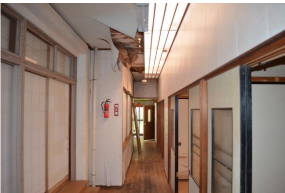
廊下部分雨漏り箇所