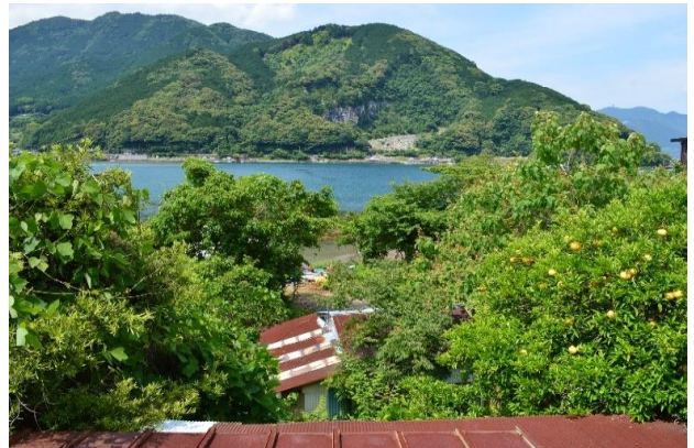
2階から海が見えます